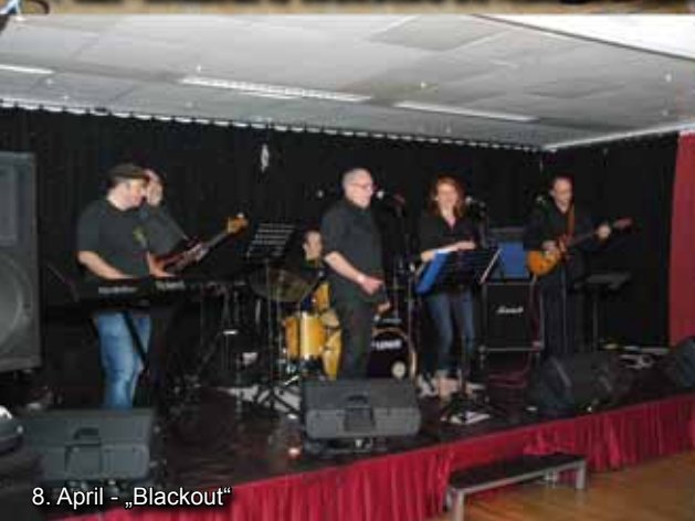
8. April - „Blackout“