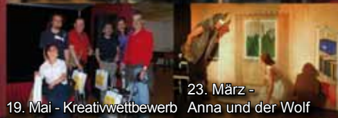
19. Mai - Kreativwettbewerb Anna und der Wolf