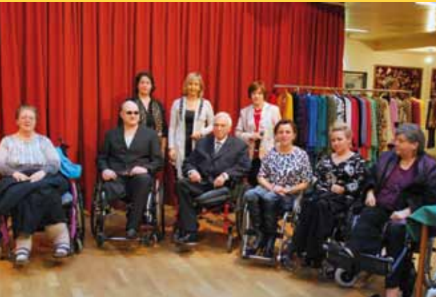
11. März - Modenschau für Sehbehinderte und RollstuhlfahrerInnen