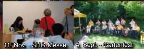
11. Nov. - SHG-Messe 4. Sept. - Gartenfest