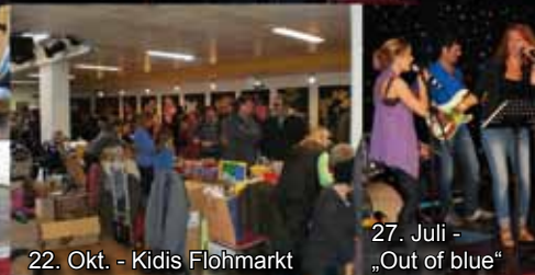
22. Okt. - Kidis Flohmarkt